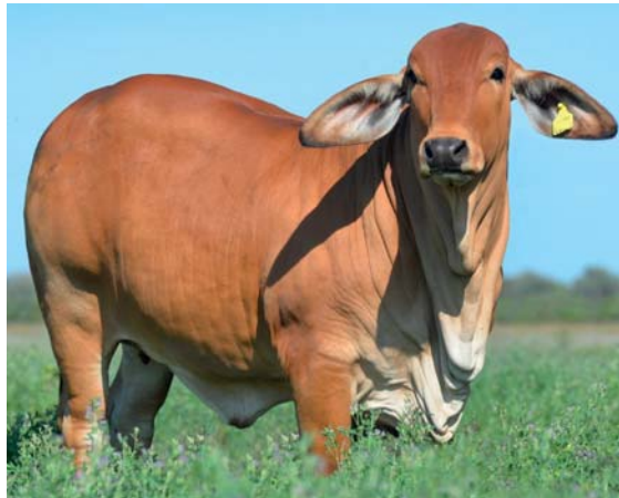
DOBLE G RP 154