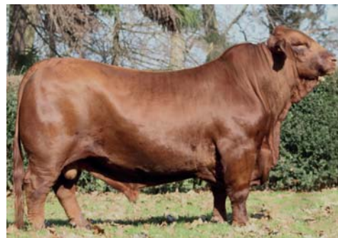
CAMBIAZO: RDO CAMPEON TERNERO MAYOR PALERMO 2017. ANCHO, PROFUNDO Y CON MUY BUEN GRADO DE ACEBUZAMIENTO