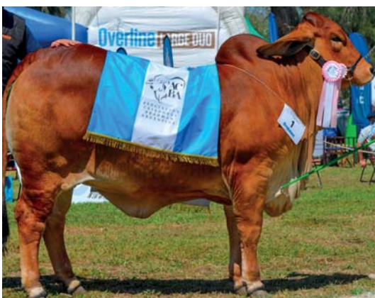
GC HEMBRA EXPOBRA 2021 Y MEJOR TERCER HEMBRA NACIONAL 2021

LA PRODUCCIÓN DE AMBOS DA COMO RESULTADO ANIMALES MUY MODERADOS, DE BUENA ESTRUCTURA, MUY CORRECTOS DE OMBLIGO Y BUENA INSERCIÓN DE GIBA.