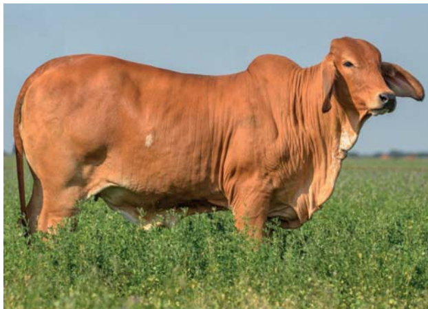
DOBLE G RP 94