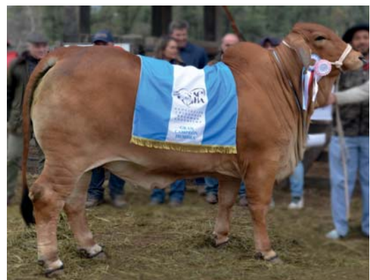
GC HEMBRA EXPOBRA 2022