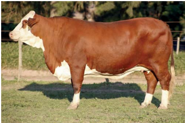
CARRETERA 13462 T/E