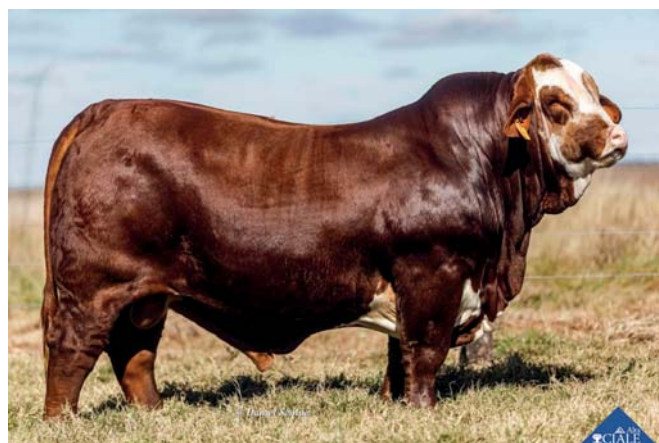
PAYESERO MARCABOTE 51M PAYE 21570 MAGICO T/E