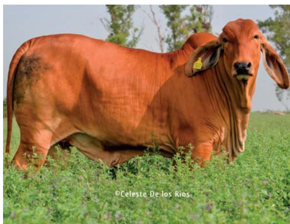
DOBLE G RP 86