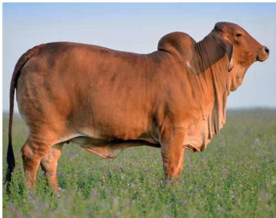
DOBLE G RP 100