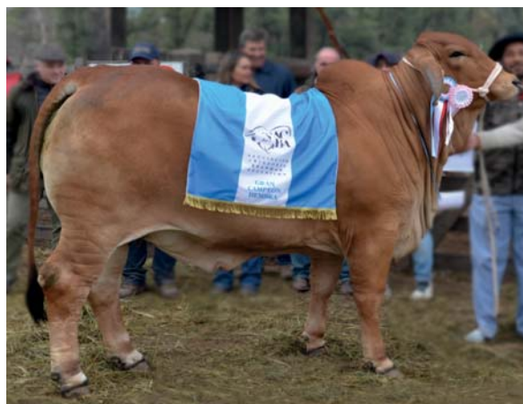
RP 118, GC HEMBRA EXPOBRA 2022

LA PRODUCCIÓN ES MUY UNIFORME Y CUALQUIER COMBINACIÓN CON LOS TOROS OFRECIDOS DARÁ MUY BUENOS RESULTADOS.