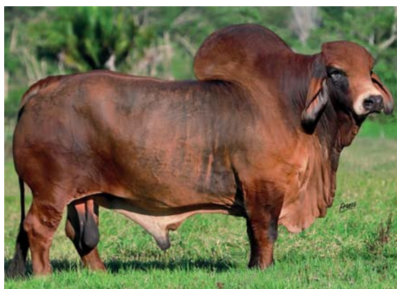
MONTERREY TANQUE TRUENO 972/8