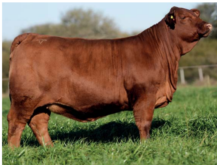
LUQUENSE 582 "SAL"