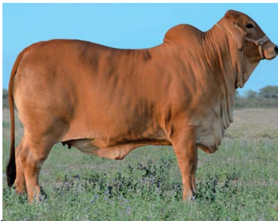
DOBLE G RP 102