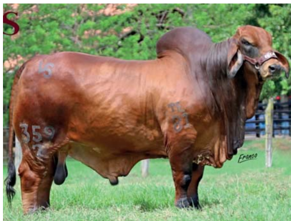
EL CANEY BENDECIDO 359/7