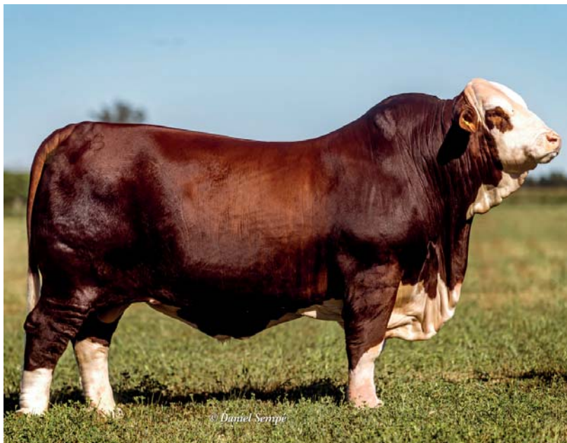
EMAYPE - GRAN CAMPEÓN MACHO EXPOBRA 2021

SE PONE A DISPOSICIÓN LA MISMA COMBINACIÓN QUE EL GRAN CAMPEÓN MACHO EXPOBRA 2021