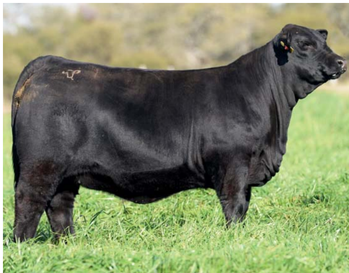
LUQUENSE 590 "PIMIENTA"