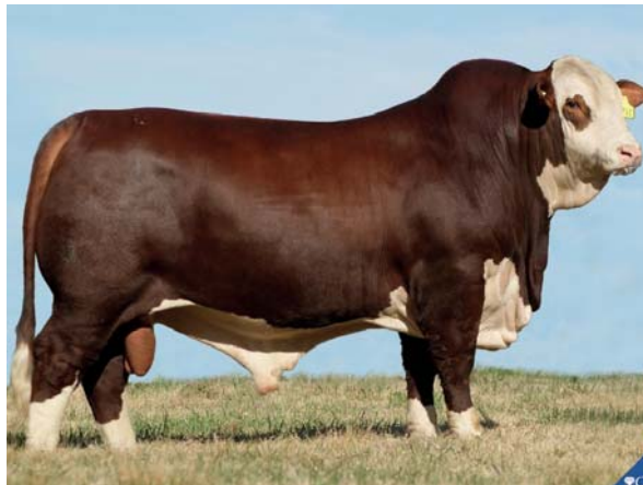
"EXPERTO" GUASUNCHOS 3125 BULON