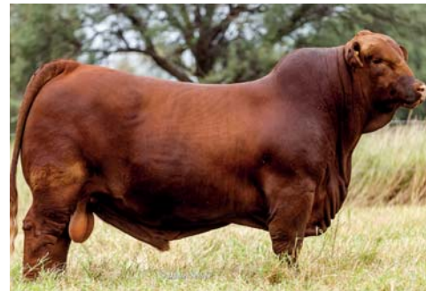
SU PADRE SORPRESA, HIJO DE MARATHON Y GRAN CAMPEÓN TERNERO DE LA NACIONAL BRANGUS. TORO DE GRAN ESTRUCTURA, CALIDAD RACIAL Y ANCHO.