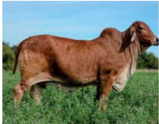
FOTO RP 72 A CAMPO

SIN DUDA UNA DE LAS COMBINACIONES QUE MÁS RESULTADOS DIERON EN LA CABAÑA, HABIÉNDONOS DADO VARIAS BANDERAS EN COMPETICIONES NACIONALES, Y TAMBIÉN LA PRODUCCIÓN DE HEMBRAS QUE HOY SON PARTE DEL PROGRAMA DE DONANTES DE PUNTA DE LA CABAÑA.