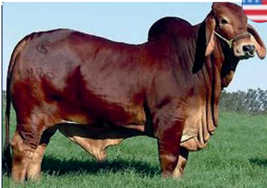
WINCHESTER MAGNUM 999/3