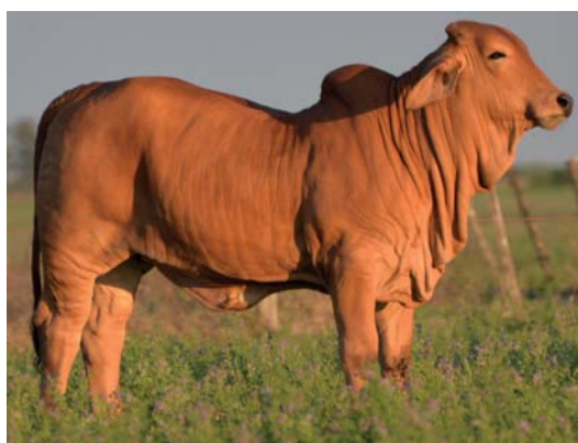
RP 206 RDA GC HEMBRA EXPOBRA 2022

LA RP 86 ES MADRE DE LA RP 206, CAMPEONA DE DUO A CORRAL, CAMPEONA INDIVIDUAL A CORRAL Y RESERVADA GRAN CAMPEONA DE EXPOBRA 2022, CON TAN SOLO 9 MESES DE EDAD.