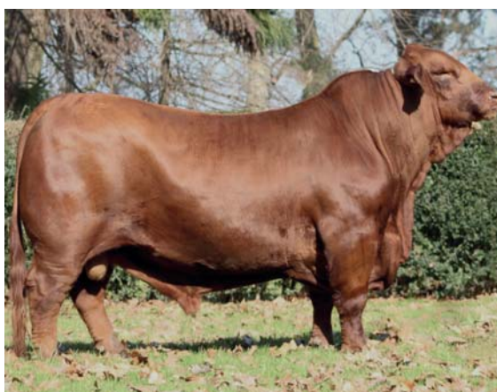
PADRE: CAMBIAZO LUQUENSE 153 T/E