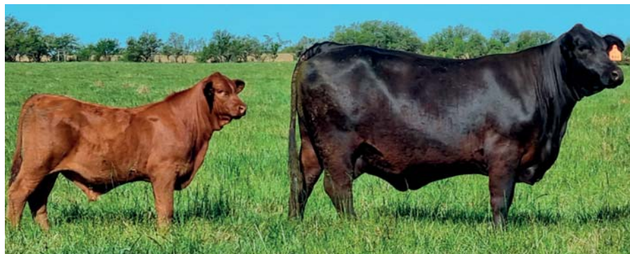
DONANTE: "GENIA LUQUENSE 306 T/E . FOTO CON CRÍA NATURAL AL PIE

SU MADRE, LUQUENSE 306 GENIA, UNA DE LAS DONANTES DEL PODIO DE LA NUEVA GENERACIÓN, COMBINA A FRANCESCO X LUQUENSE 036 REINA, MADRE DE JALAPEÑO Y PRECIO RECORD DE BRA + BRA, COMERCIALIZADO POR SEMEX.