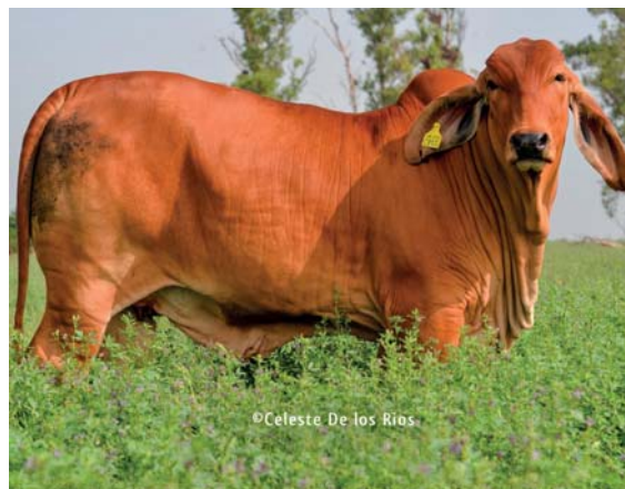
DOBLE G RP 86