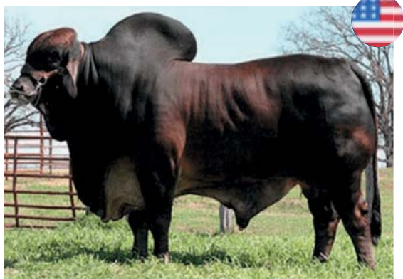
VL ROJO APACHE 1/50

LA RP 94 ES UNA HEMBRA MUY PROFUNDA, CON BUENA COSTILLA Y BUEN HUESO.