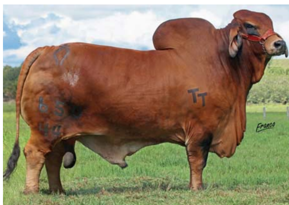
TRUENO MONARCA 650/44